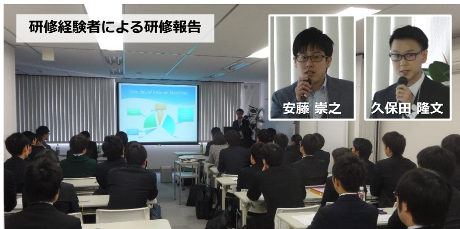
研修経験者による研修報告